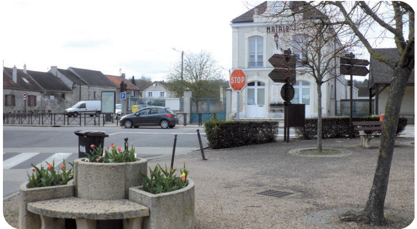
Le cœur du village avec son accueillante place et au fond la mairie

Le Musée de la Grande Guerre, dont la première pierre fut posée le 17 avril 2010,