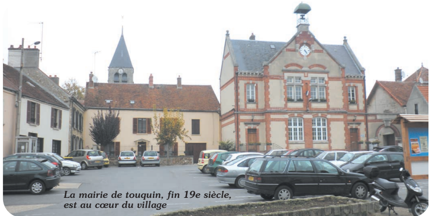
La mairie de touquin, fin 19e siècle, est au cœur du village

reliques de Sainte Restitue et de J.J. Ollier, seigneur de Touquin au 18ème siècle..