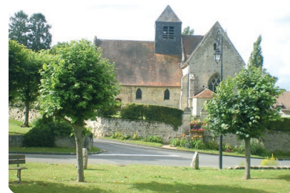
L'église vue de la place du village.

Pour contacter l'association : Christine Olry, portable 06 07 73 29 34.