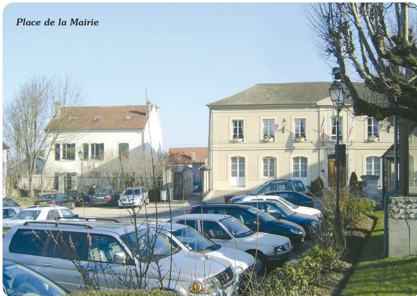
Place de la Mairie

illustres personnages de la famille et l'un des plus précieux pour le village : il débute l'assèchement des marais de Lesches puis, avec sa femme Anne, confie l'administration du collège du Mont-de-Piété aux religieux de l'ordre de la Sainte-Trinité.