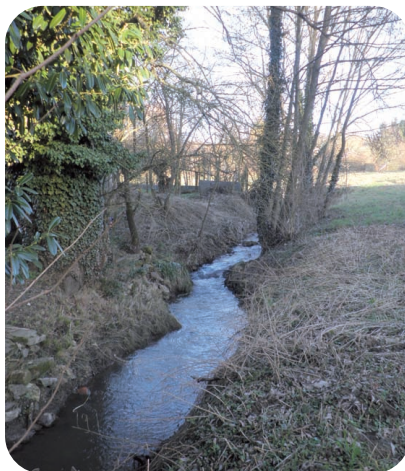
Ru du Pont-Foirier ou Ordrimouille ? Qui sait ?

Au contraire de ce solide lavoir « bâtisse », le deuxième lavoir de Beuvardes, à la sortie du