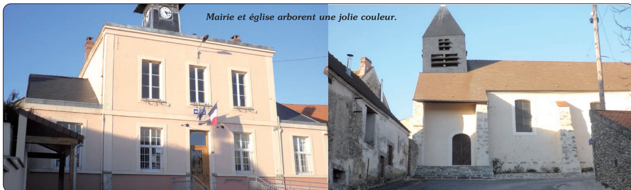
Mairie et église arborent une jolie couleur.