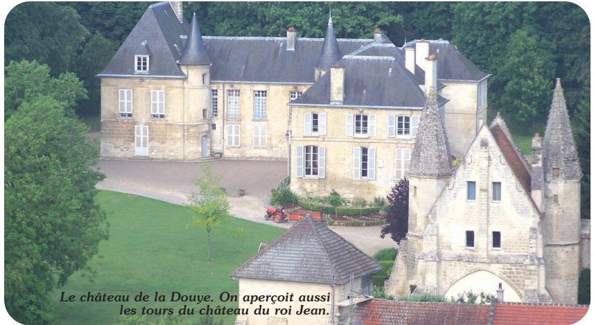
Le château de la Douye. On aperçoit aussi les tours du château du roi Jean.

tions, aux nombreux commerces. Des sentiers de randonnée permettent de découvrir cette jolie région qu'est la Vallée de l'Automne et deux vous feront aussi découvrir le village : « le tour du paradis » de 10km et « le feu de Sainte Luce » de 6 km partent de la place du Marché.