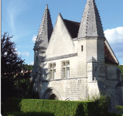
Le château du roi Jean.

Béthisy-Saint-Pierre aujourd'hui est un village accueillant, aux nombreuses associa-