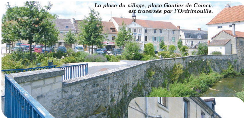
La place du village, place Gautier de Coincy, est traversée par l'Ordrimouille.

disparue, offre un intéressant survol artistique de l'art religieux du XI e au XVIII e siècle.