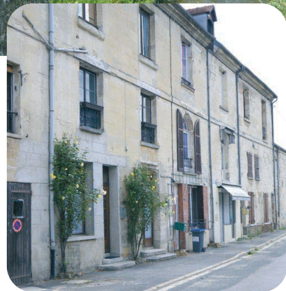
Les bâtiments du prieuré ont été vendus à la Révolution. On distingue clairement le découpage en maisons individuelles.

Dans «Les miracles de Notre-Dame», la grande œuvre de sa vie, il introduisit pour la première fois la langue française dans un sujet sacré ! La Vierge y ressemble