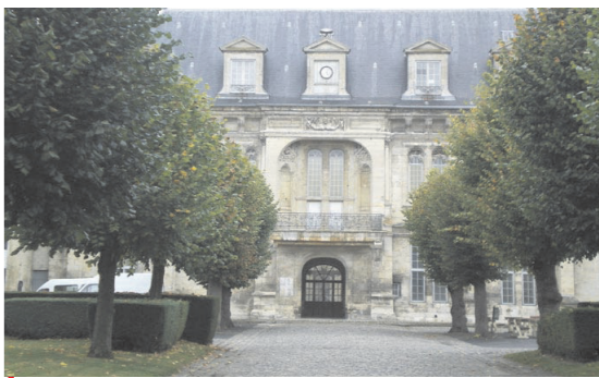
Le palais de François 1 er , à Villers-Cotterêts, était en fait une demeure de chasse.