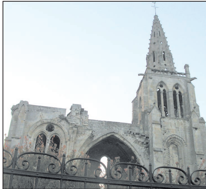
Ci-dessus, vue de l'église de la rue La-Fontaine, du côté du square au monument aux morts sculpté par Albert Bartholomé.

On en apprend un peu plus sur les traditions des bâtisseurs, sur les possibles origines de la franc-maçonnerie et sur le pouvoir qu'avaient les maçons, des hommes libres .