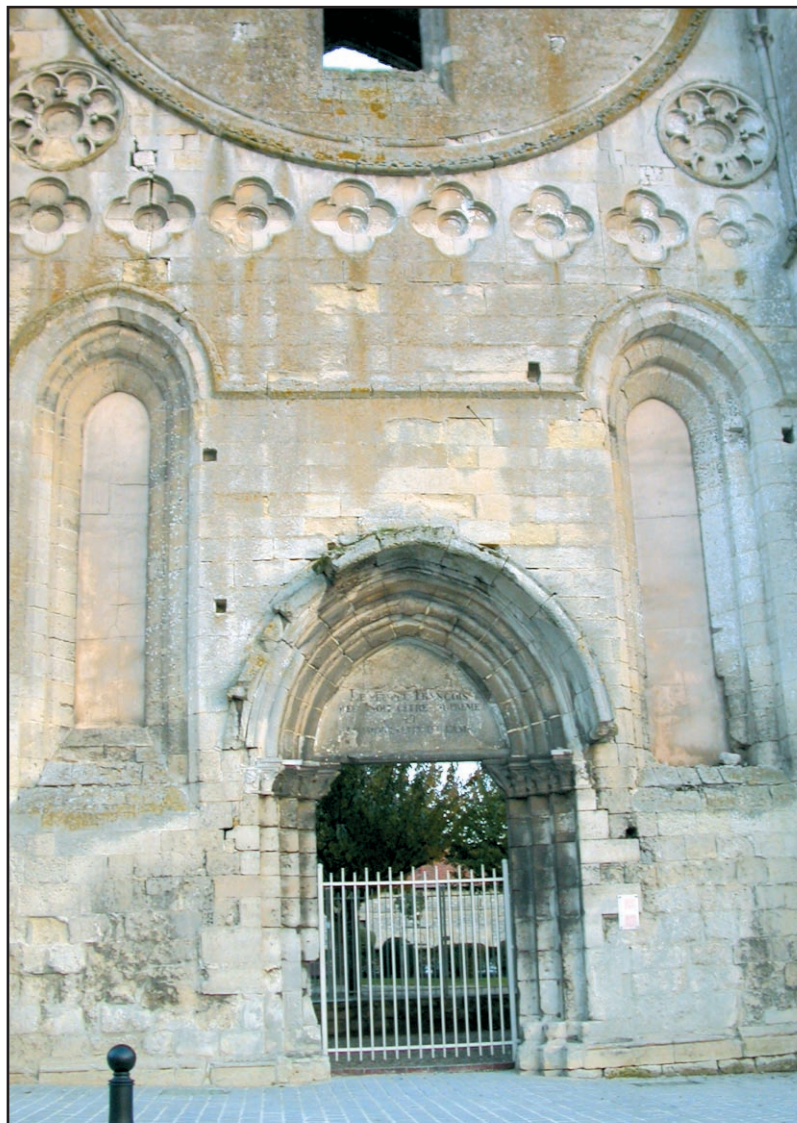
Ci-dessous, la façade au frontispice de laquelle est inscrite (peinte) la phrase : Le peuple français reconnaît l'Etre Suprême et l'Immortalité de l'âme.