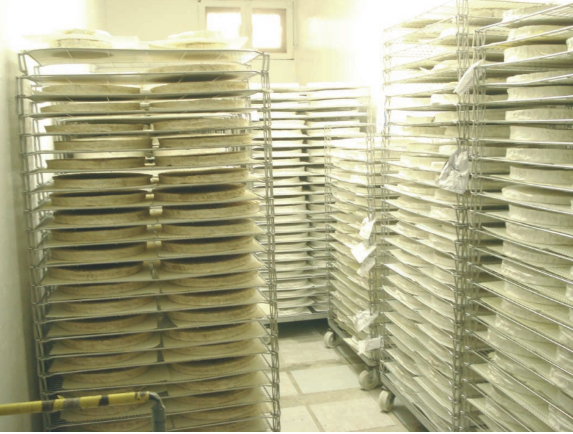
Le grand frère et le petit frère : Brie de Meaux et Brie de Melun.