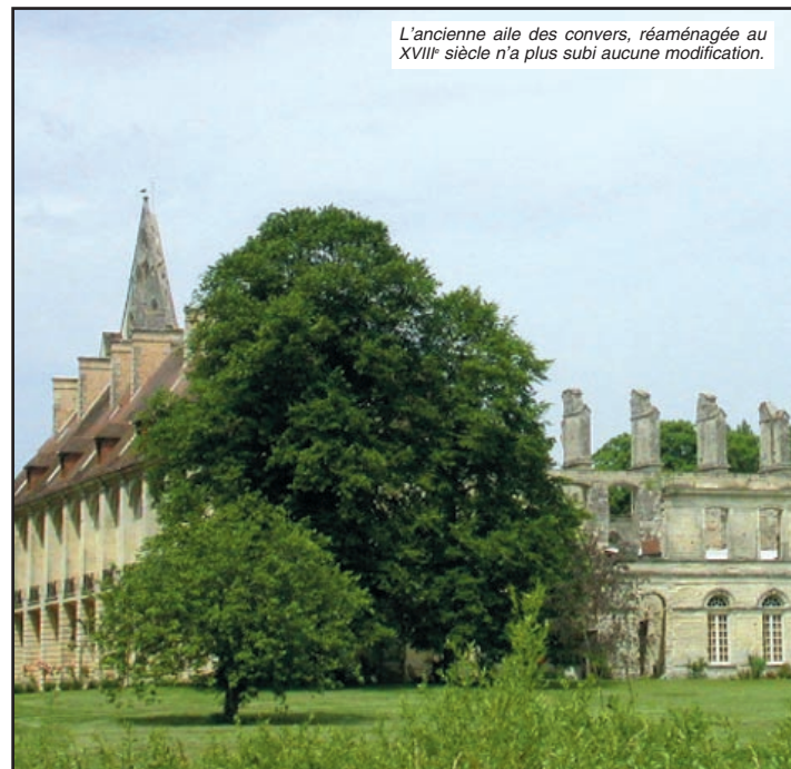
L'ancienne aile des convers, réaménagée au XVIII e siècle n'a plus subi aucune modification.