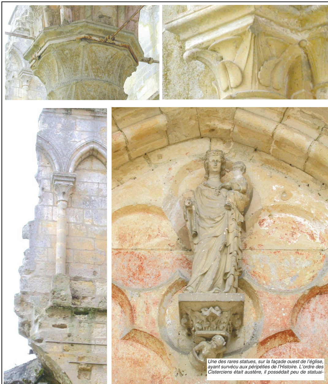
Une des rares statues, sur la façade ouest de l'église, ayant survécu aux péripéties de l'Histoire. L'ordre des Cisterciens était austère, il possédait peu de statua-

Sources : Abbaye de Longpont , A. P. Montesquiou, éditions Gaud ; brochures Office Intercommunal du Tourisme de Villers-Cotterêts ; Autour de Villers-Cotterêts , collection Mémoire en Images , éditions Alan Sutton.